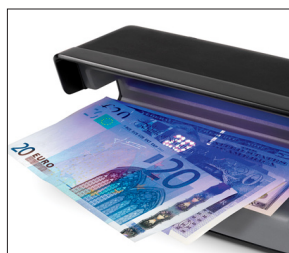
Verifica tutte le valute