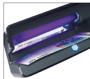
Con riflettore per una qualità di luce UV estremamente potente