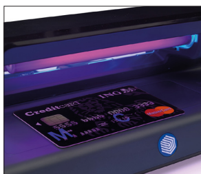
Verifica carte di credito, passaporti e altri documenti di identità