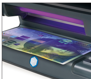
Verifica le caratteristiche UV di banconote